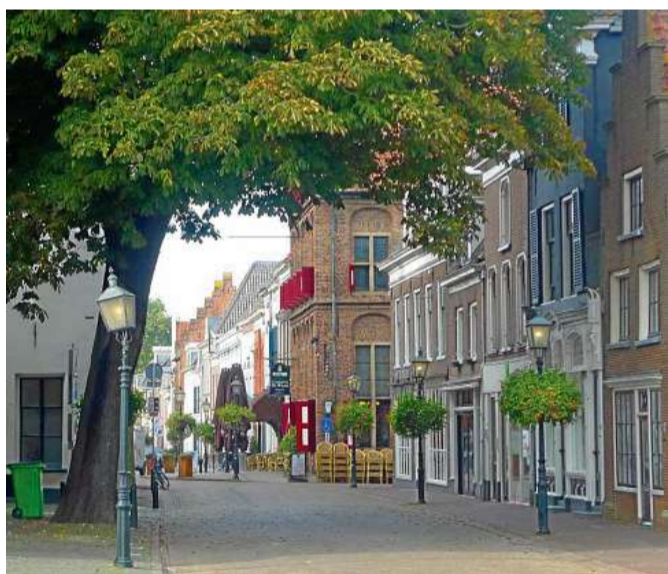
Typisch niederländisches Flair prägt die Straßen.