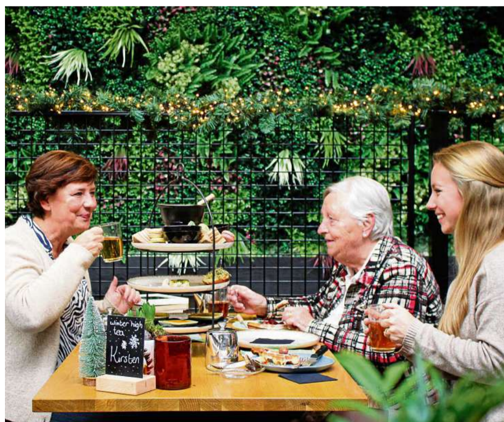
Eine Stärkung in weihnachtlicher Atmosphäre gibt es im Café.

Genießen und schlemmen Zwischen den Einkäufen haben die Besucher die Möglichkeit, in einem der beiden