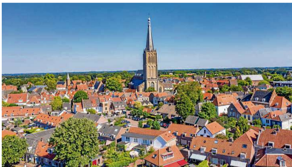
Kunst und Kultur genießen in der Hansestadt einen hohen Stellenwert.