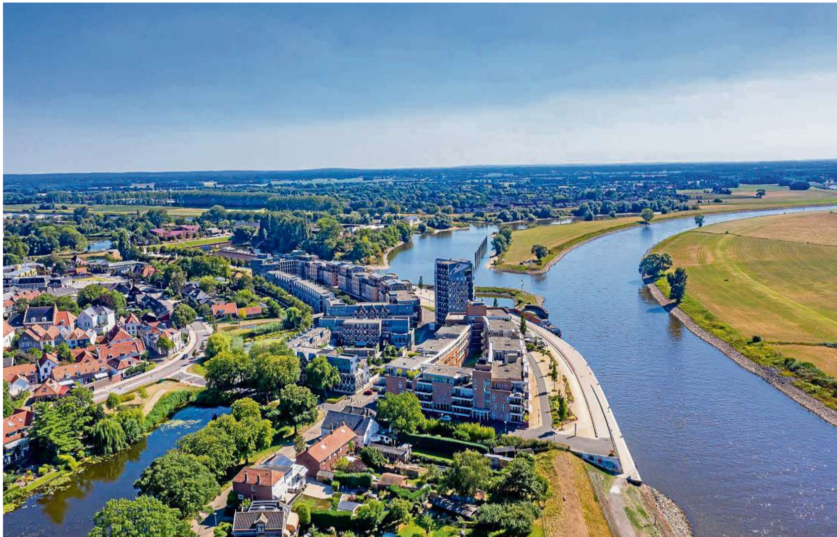
Bei einem Spaziergang durch Doesburg an der IJssel begegnen Besucher einem Mix aus Vergangenheit und Gegenwart.